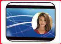
LCD จอสี TFT โชว์รูปพนักงาน