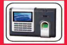
Body ใช้วัสดุ แข็งแรง ทนทาน