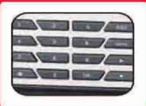
ปุ่มกดแข็งแรง