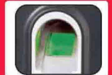
หัวอ่านเป็น แบบกระจก

รองรับได้ 3,000 ลายนิ้วมือ บันทึกได้ 100,000 รายการ เชื่อมต่อ RS 232, RS485 TCP/IP, USB Flash Drive หัวอ่านกระจก แข็งแรงทนทาน อ่านลายนิ้วมือได้เร็ว 1 วินาที มีเสียงตอบรับเป็นภาษาไทย